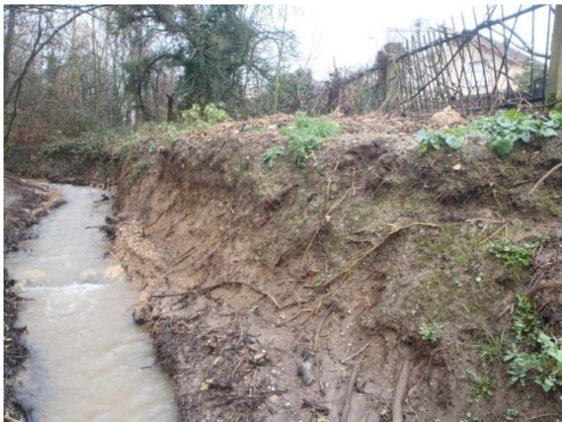
Site 5 : avant les travaux de talutage