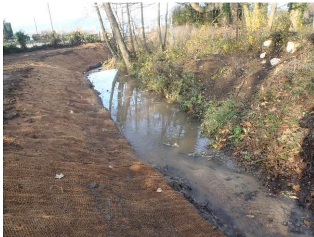
Site 5 : après les travaux de talutage