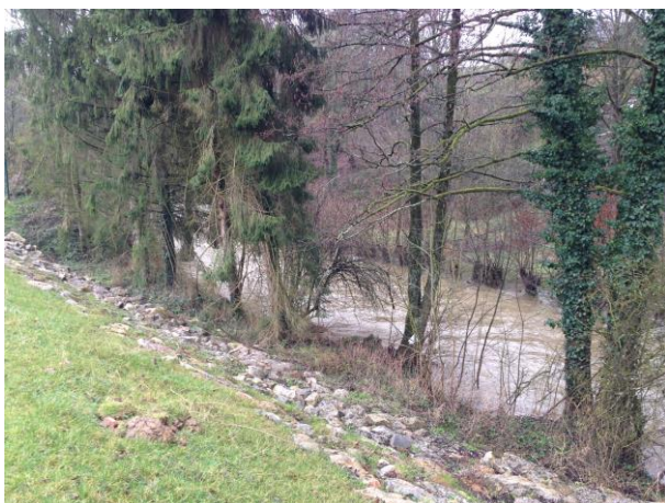
Alignement de sapins abattus en bordure du Gland