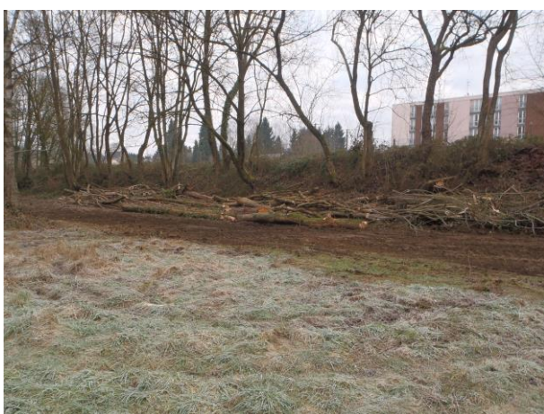
Tas de bois déposés en haut de berge