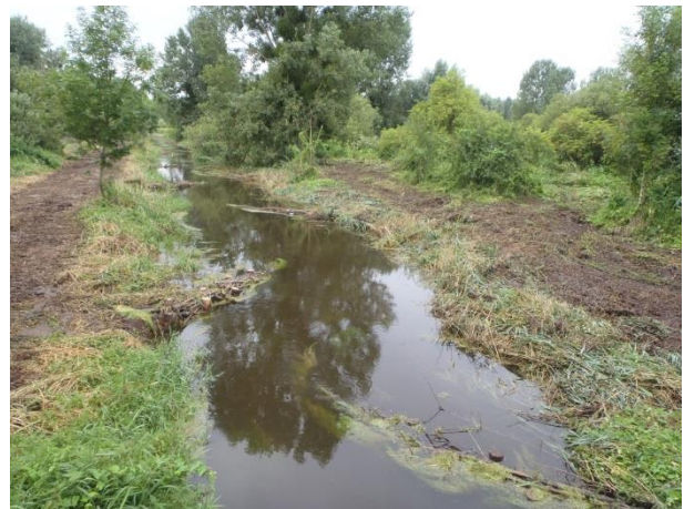
L'Ardon au 04 août