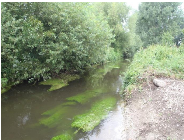
Branches basses taillées