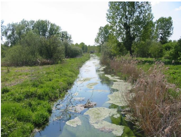
Etat initial de l'Ardon

Les travaux de diversification des écoulements (pose d'épis déflecteurs) de la rivière Ardon sont terminés. Des plantations complémentaires aux aménagements seront réalisées en période propice (octobre/novembre).