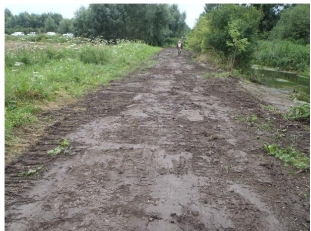
Remise en état et ensemencement de la bande enherbée