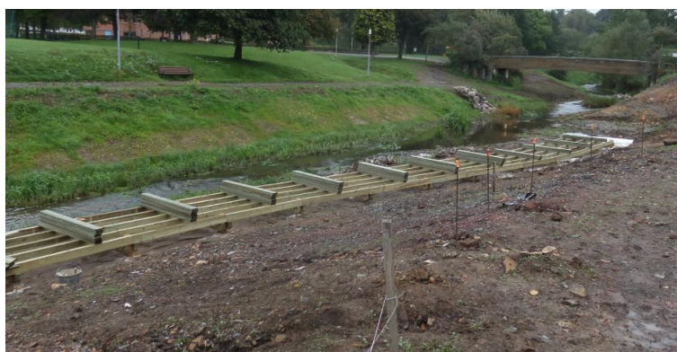
Cheminement piéton de bas de berge (vue vers l'amont)