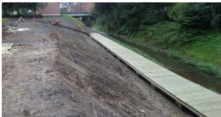
Cheminement piéton de bas de berge (vue vers l'aval)