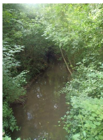
Tronçon Retz 7 après travaux