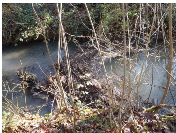
Tronçon Retz 7 avant travaux