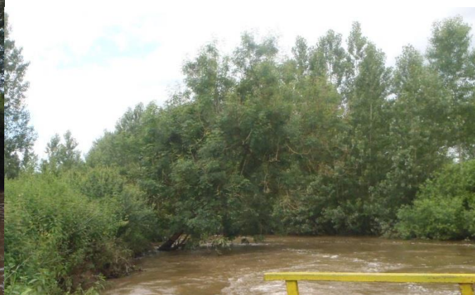
Arbre fortement penchant sur le tronçon OMT