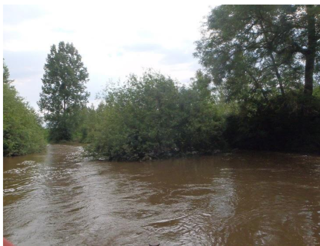
Embâcle problématique sur le tronçon OMT