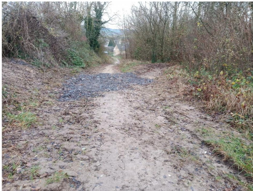
Saignée et noue n°1

La noue n° 2 n'ayant pas été effectuée (voir CR de lancement), le premier cassis aurait été davantage initiateur de danger en aval. Celui-ci n'a donc pas été réalisé. Le deuxième, situé plus bas dans le chemin, a donc été renforcé afin d'être plus efficace. De gros enrochements ont été posés pour maintenir l'aménagement. Du béton a été coulé par-dessus, puis peigné. Cet aménagement, bien qu'imposant de part les matériaux utilisés, se devait de rester solide. En effet, les engins agricoles tels que les moissonneuses batteuses des exploitants, empruntent régulièrement ce passage.