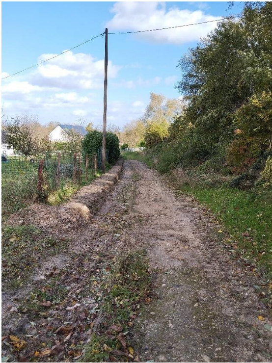
Débernage du chemin de la Garenne