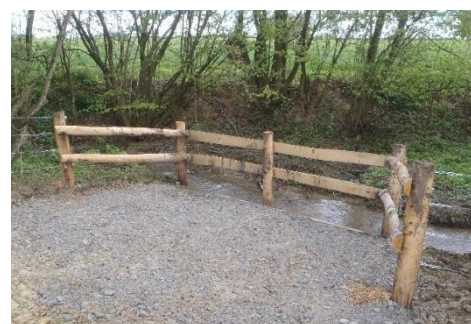
Exemple d'abreuvoir rustique