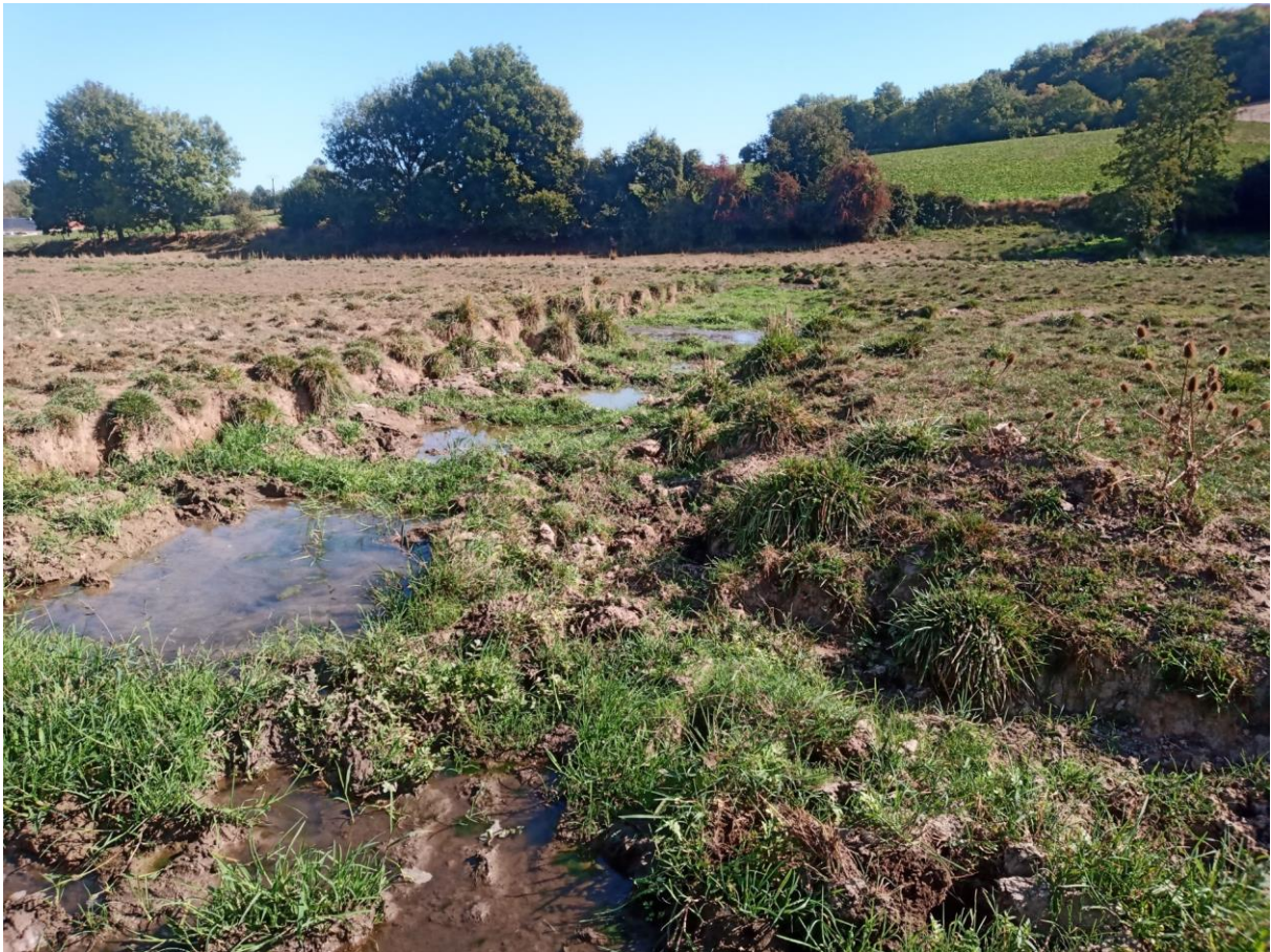
Lit très large et piétiné (zone médiane du site n°3)