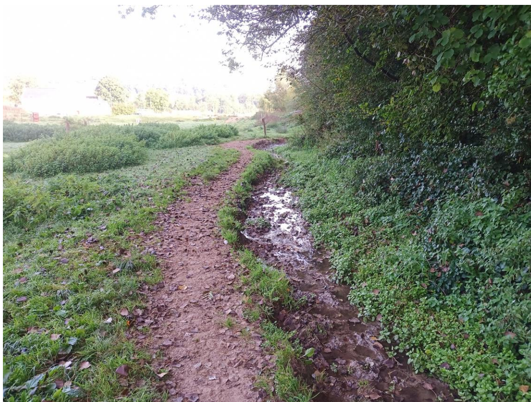
Lit très large et piétiné (zone amont du site n°3)