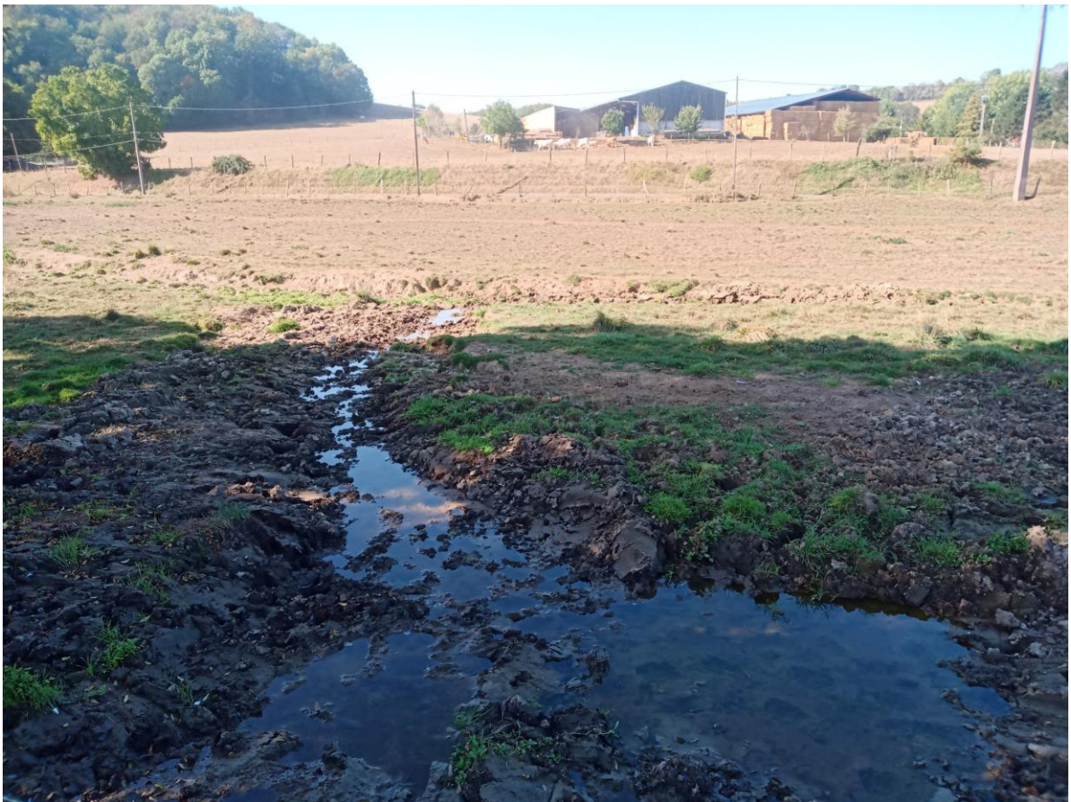
Zone de source piétinée (site n°3)