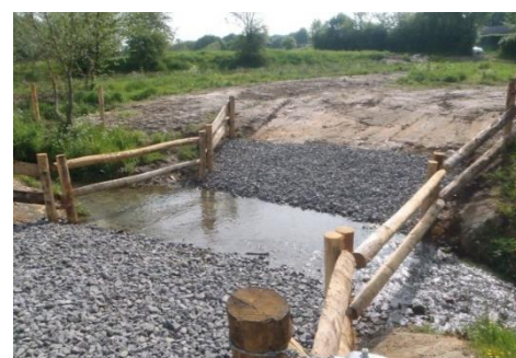
Exemple de passage à gué