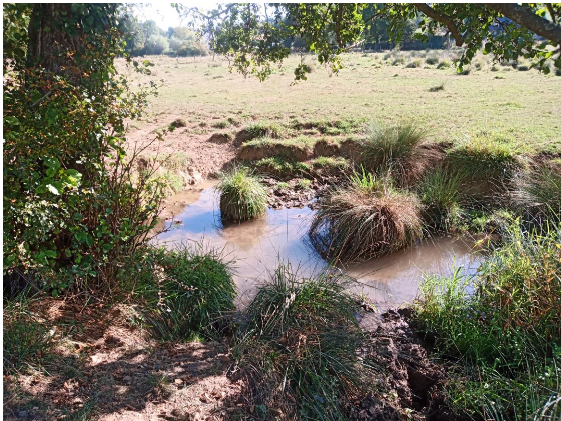
Zone de piétinements et traversée des bovins (site n°4)