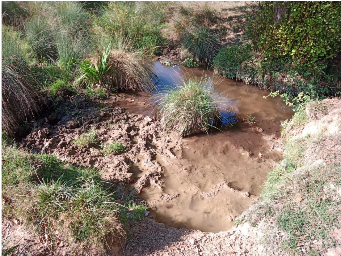
Zone de piétinements et traversée des bovins (site n°4)