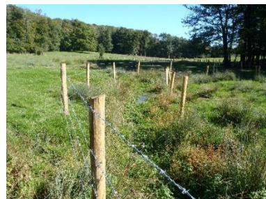
Exemple de clôtures fixes

Les piquets seront en châtaigner d'une longueur totale de 2,50 m, hors sol 1,30 m, intervalle de \pm 3,50 m avec 4 rangs de fil barbelé.