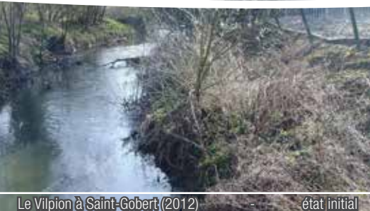
Le Vilpion à Saint-Gobert (2012)

“ Face aux aménagements de génie civil contraignant pour le milieu naturel et la nécessité d'intervenir pour protéger les enjeux des abords des cours d'eau, le génie végétal apparaît comme une alternative judicieuse en matière de lutte contre l'érosion et de préservation de nos rivières. ”