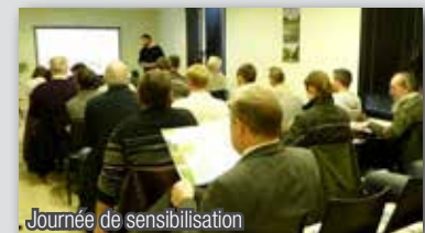
Journée de sensibilisation

Deux journées d'information ont été organisées par l'Entente Oise-Aisne à Noyon les 20 et 30 novembre 2012 afin de sensibiliser les agriculteurs et les syndicats de rivières sur la problématique de la berce du Caucase, mais également sur les nombreuses autres plantes envahissantes présentes dans l'Aisne.