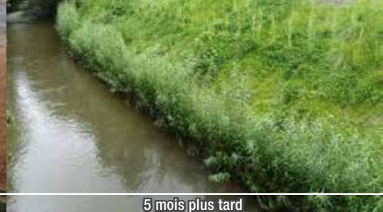
5 mois plus tard