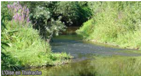
L'Oise en Thiérache

Allez plus loin : www.entente-oise-aisne.fr