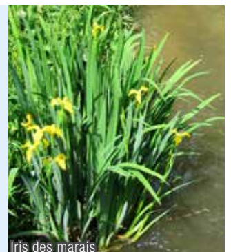
Irises des marais