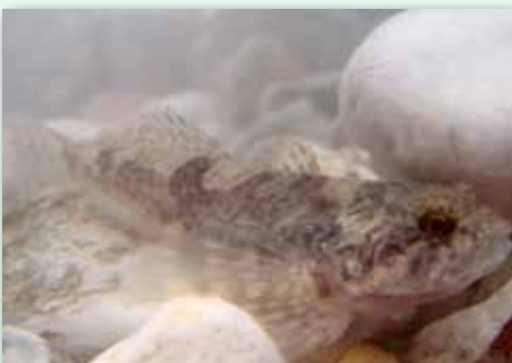
Chabot dans son milieu naturel

Le chabot, en latin Cottus Gobio , est un petit poisson vivant dans nos rivières, très discret et donc peu connu. Il est impossible de le confondre avec un autre poisson, tant sa tête et ses yeux sont énormes par rapport au reste du corps. Il paraît être entièrement lisse, mais en réalité il est recouvert de minuscules écailles. D'une longévité de 3 à 6 ans, le chabot mesure en moyenne 10 cm. Il préfère vivre dans les eaux fraîches et rapides, mais il fréquente aussi les lacs alpins. Territorial et sédentaire, il se tient caché la journée au fond de l'eau qu'il ne quittera que la nuit pour aller chasser. Pour le découvrir, il suffit de soulever doucement les pierres dans un ruisseau, et s'il ne se sent pas menacé, il ne bougera pas. Le chabot se nourrit de larves aquatiques et de crustacés, mais peut également se laisser tenter par de petits alevins ou des œufs d'autres poissons. Sa reproduction se déroule en mars/avril. Le mâle prépare un nid sommaire sous une pierre où il attire sa femelle. Cette dernière y pond entre 100 et 300 œufs. Le chabot, n'est pas recherché par les pêcheurs qui ne les attrapent que par accident en voulant pêcher le vairon ou le goujon. Sa présence, indique une bonne qualité de l'eau.