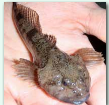
Chabot vue de face

Classé parmi les poissons vulnérables en Europe, le chabot n'est globalement pas menacé en France, mais ses populations locales peuvent l'être suite à des pollutions ou au recalibrage des cours d'eau.